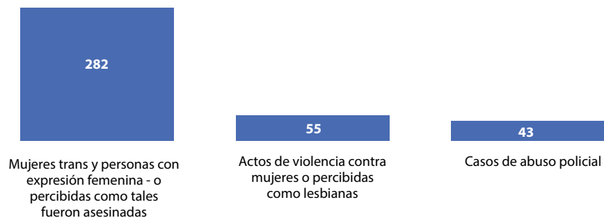
Figura 2. Registro de violencia LGBTIQ en Latinoamérica, 2013