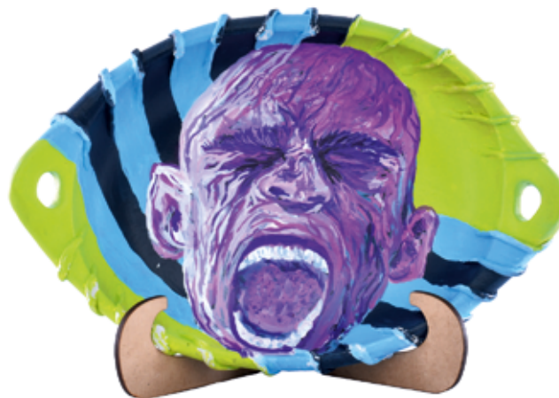
Título: Realidad Autor: Alejandro Vargas Técnica: Aerosol y acrílico