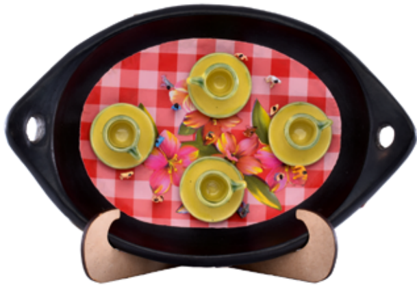
Título: El Gran Convite Autor: Yulieth Guerrero Nieto Técnica: Mixta