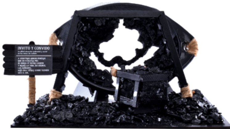
Título: "Humo en los Pulmones" Autor: Iván Mauricio Torres Moreno Técnica: Mixta