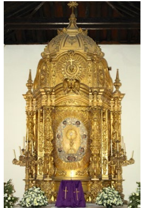
Figura 6. Tabernáculo Barroco del Siglo XVIII en la Catedral Metropolitana de Tunja.