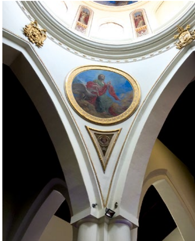
Figura 8. Pechina con la imagen de San Juan, Pintura Mural del Pintor Ricardo Acevedo Bernal.

En las pechinas que soportan la cúpula, está la representación de los cuatro evangelistas: San Mateo y San Juan que estuvieron entre los 12 apóstoles, San Marcos y San Lucas que fueron discípulos de ellos.