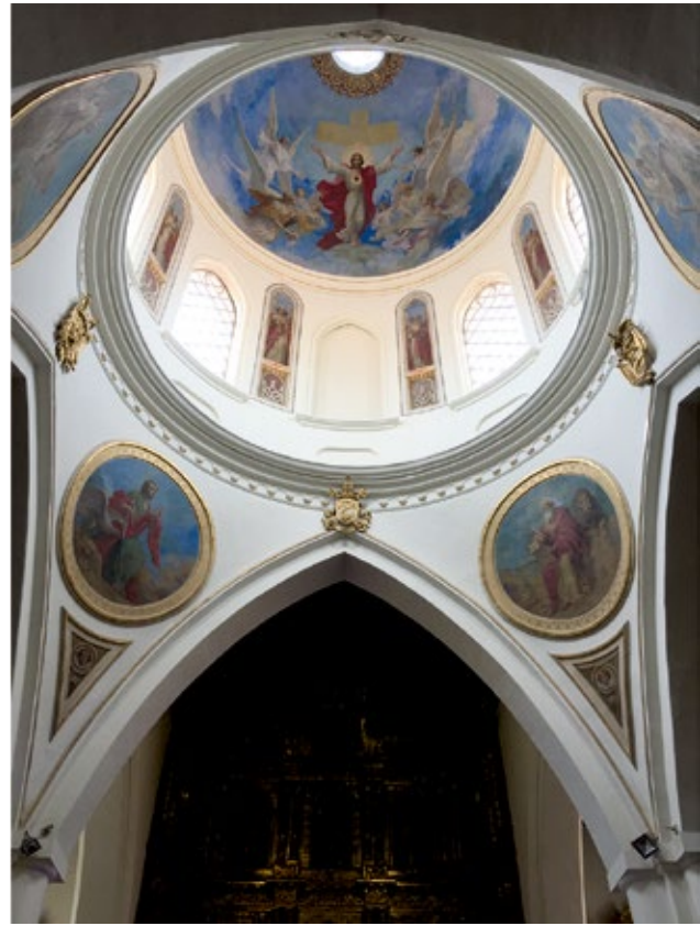
Figura 7. Cristo Triunfante y Transfigurado. Pintura Mural en la Cúpula de la Catedral Metropolitana de Tunja. Pintor: Ricardo Acevedo Bernal.