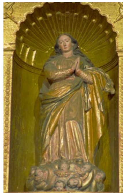
Figura 3. Virgen Inmaculada – Escultura Ubicada en la calle central y cuerpo superior del retablo mayor.

En el bautismo de Jesucristo se manifestaron las tres personas: se oyó la voz de Dios Padre cuando se bautizaba a Cristo, Dios Hijo, y Dios Espíritu Santo se dejó ver en forma de paloma 16 . Así, este hecho y su representación facilitó la representación de la Trinidad (Maquívar, 2006, pág. 44). Muy difícil fue representar plásticamente a un Dios que es uno y trino a la vez. Louis Réau expresa la dificultad para expresar la unidad y la pluralidad con la misma fuerza y a un tiempo (Réau, 2000, pág. 39).