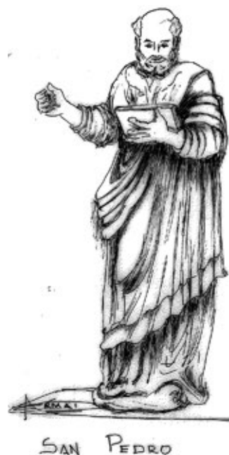
Figura 5. Escultura en madera de San Pedro, hace parte del Retablo Mayor.

A San Pablo, a la izquierda de la cátedra, en el cuerpo inferior del retablo, se le representa con la espada por ser ilustre portador de la Palabra de Dios y célebre estudioso de las Sagradas Escrituras: “(...) la Palabra divina como espada de doble filo ” 24 . Al apóstol también se le representa con la espada porque fue el instrumento del martirio. Fue decapitado extramuros (fuera de Roma); por ser ciudadano romano no fue sometido a crucifixión.