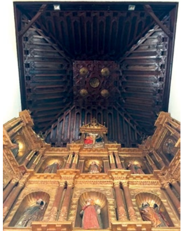
Figura 4. Artesonado Mudéjar sobre Retablo Mayor de la Catedral Metropolitana de Tunja.

cada una cumplía funciones diversas, en su confluencia se orientaban hacia el fin común de servir de escena y objeto de culto a las prácticas devocionales y a la liturgia (González, Los retablos y las organizaciones de las imágenes escultóricas, 2012, pág. 1).