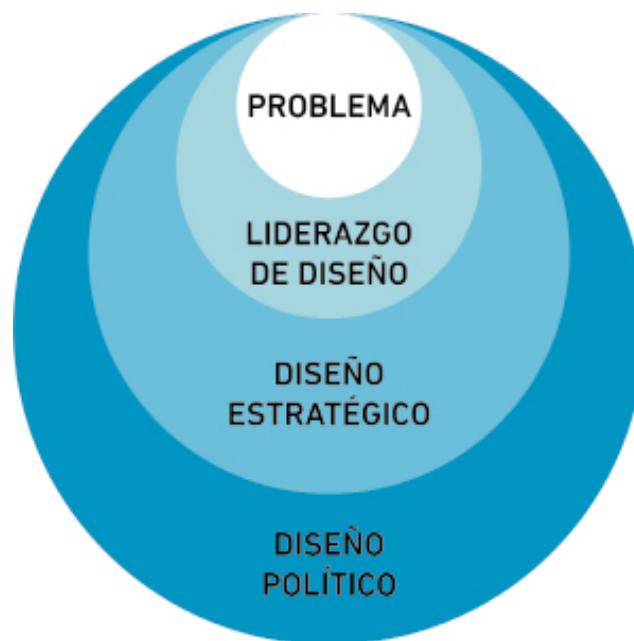
Figura 1. Jerarquía relativa del diseño estratégico.

Es así entonces, que el diseño estratégico se vale de una posición jerárquica que se ubica entre el liderazgo y la política de diseño (Gusakov, 2020). Este enfoque se basa en la selección y ajuste de las variables que debería incluir un proyecto –como pueden ser las tecnológicas, productivas, comunicacionales, de distribución y de uso– para alcanzar un determinado objetivo (Rittel y Webber, 1973).