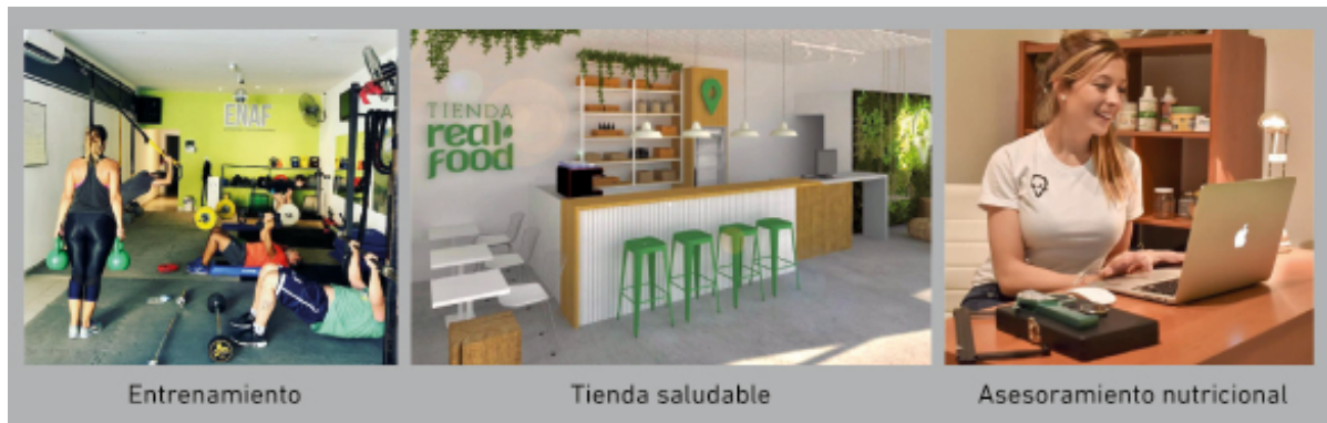
Figura 4. Imágenes del espacio integral.

Una marca de ropa deportiva local, financió la producción de murales artísticos para el interior del espacio y suministra la vestimenta corporativa de entrenadores y empleados, a su vez que ofrece a sus clientes indumentaria con la imagen del ENAF. En cuanto a los alimentos para la tienda, fueron específicamente seleccionados proveedores que sustenten la filosofía saludable. Para ello se seleccionaron productos naturales y de origen controlado, desarrollados por productores locales.