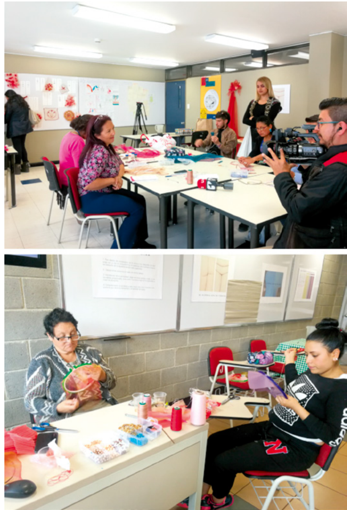
Figura 2. Taller de conceptualización–Laboratorio vivo.

“Al mismo tiempo, y ello no es contradictorio, cuando la identidad es un recurso, se crea una valorización de la autonomía y de la identidad, como valor, como subjetividad contra las identidades atribuidas, pesadas o impuestas las que frenan (...) la libertad del ciudadano”. (Dubet, 1989, p. 526).