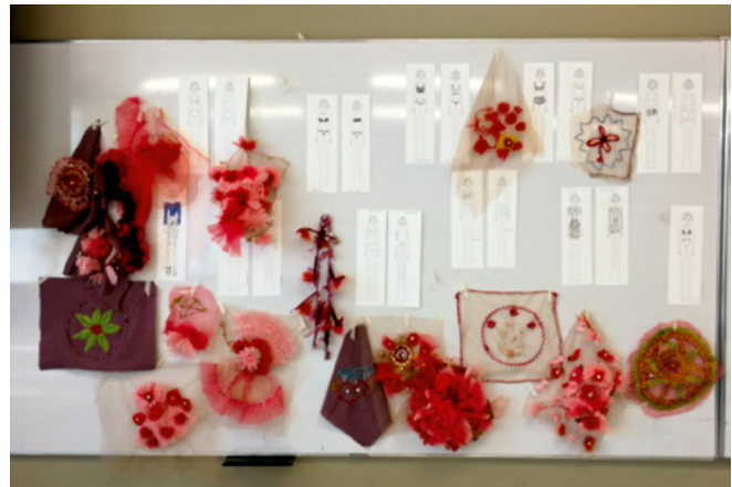
Figura 1. Cuerpo, historia y narrativa en textil.