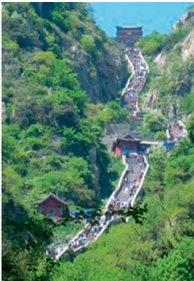
Figura 3. Montes sagrados de Taishan