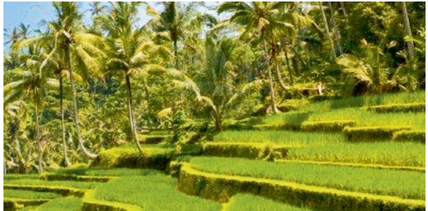
Figura 2. Cultivos de arroz en Indonesia

Son el resultado de condicionantes sociales, económicas y políticas, entre otras. Tal es el caso de los cultivos de arroz en Indonesia, donde se aprovechan las características geográficas y se privilegia la interacción de los pobladores con el medio en aras de alcanzar el objetivo planteado, como es la producción del cereal en una atmósfera de armonización con el entorno.