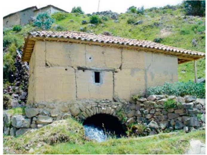
Figura 5. Paisaje Socotense - Boyacá

Al ser el paisaje el eje central, se confiere a la Ruta una visión no contemplada aún en los planes de desarrollo municipales y territoriales. A partir de esta óptica se determinan objetivos de intervención, como son la integralidad del territorio, la preservación de los recursos naturales y patrimoniales, y la implementación de programas destinados a incentivar el desarrollo económico de las regiones integrantes. En este contexto se pone en primer plano la pertinencia de impulsar la cooperación entre los municipios, pues al perseguir una causa común se multiplican las oportunidades para emprender programas de turismo especializado, educación ambiental, conservación del patrimonio material e inmaterial y búsqueda de declaratorias que respalden la visibilidad de cada lugar.