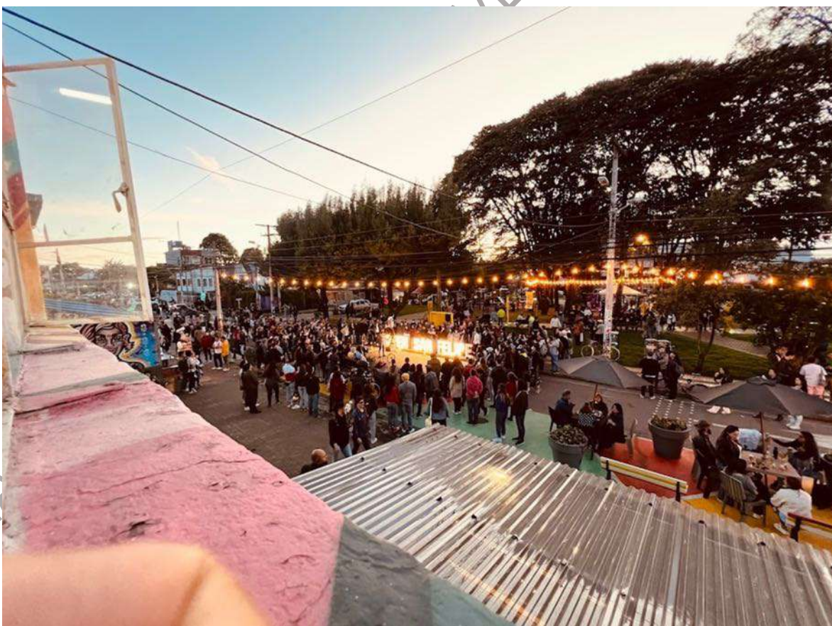
Figura 2. Festival Open San Felipe, Bogotá.