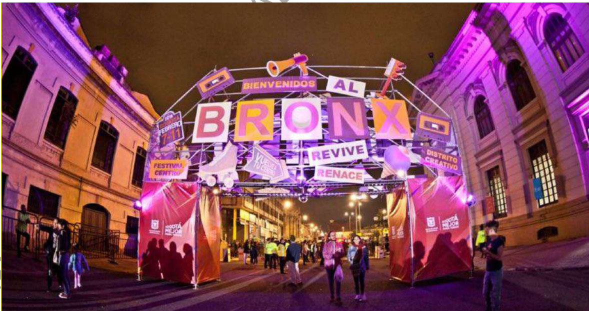
Figura 1. Bronx Distrito Creativo, Bogotá.

Nota. Tomado de Bogotá contará con 12 Áreas de Desarrollo Naranja para impulsar el arte, la cultura y la creatividad [Fotografía], por Secretaría de Cultura, Recreación y Deporte de Bogotá, 2020, ( https://economianaranja.gov.co/noticias/posts/2020/diciembre/bogota-contara-con-12-areas-de-desarrollo-naranja-para-impulsar-el-arte-la-cultura-y-la-creatividad/ )