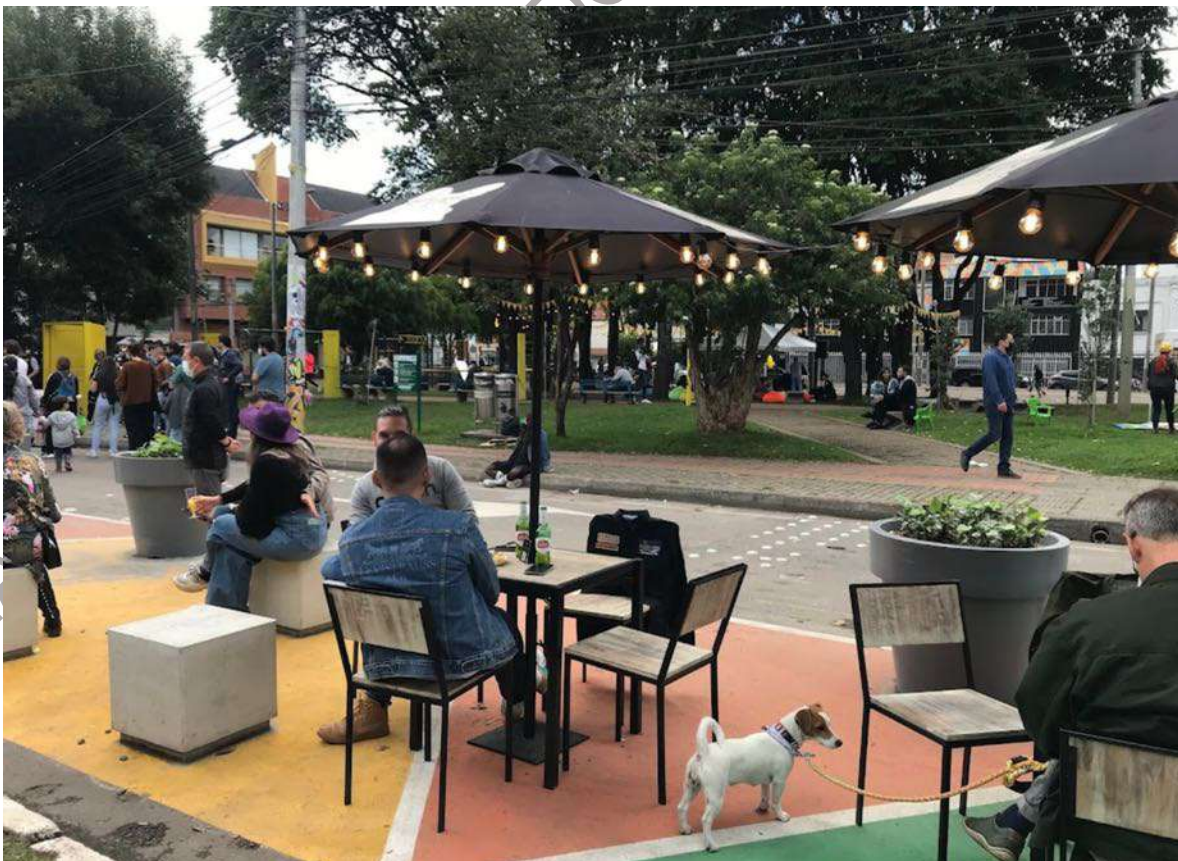
Figura 1. Distrito Creativo Open San Felipe – Parque la araña, Bogotá.