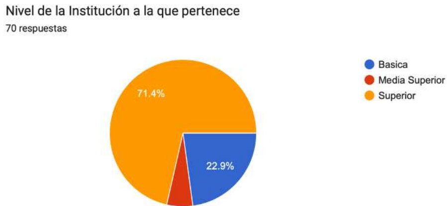
Figura 2. Nivel de la institución a la que pertenece

Al analizar la composición por grupos, se observa que el 68.6% de los participantes son profesores, seguido por un 11.4% de estudiantes. La presencia de profesores de apoyo, directores, y otros miembros del equipo directivo muestra la representatividad de diversos actores dentro de la comunidad educativa. En cuanto al nivel educativo, el 71.4% pertenece a instituciones de nivel superior, seguido por un 22.9% en el nivel básico y un 5.7% en el nivel medio superior.