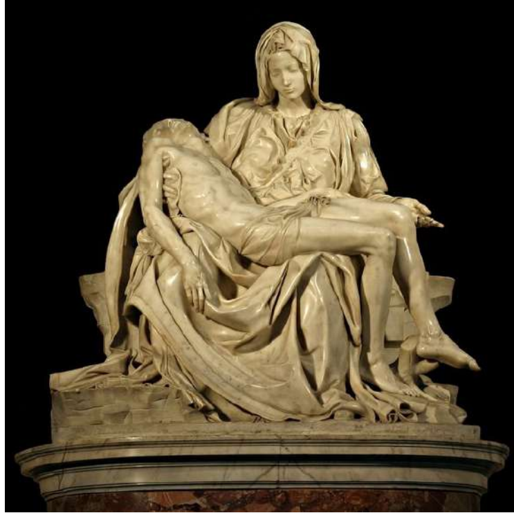
Piedad del Vaticano. Basílica de San Pedro