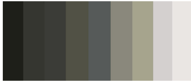
Figura 2. Escala cromática

cruel e inhumano, la falta de sentimiento. En el caso de los animales este color permite el camuflaje sin importar su tamaño. Todas estas emociones se ven representadas en la pintura, pues el color que más predomina es el gris, por ende, se evidencia la carga de emociones negativas en el mensaje del cuadro, ya que toma como escenario uno de los eventos más difíciles en la historia española y mundial.