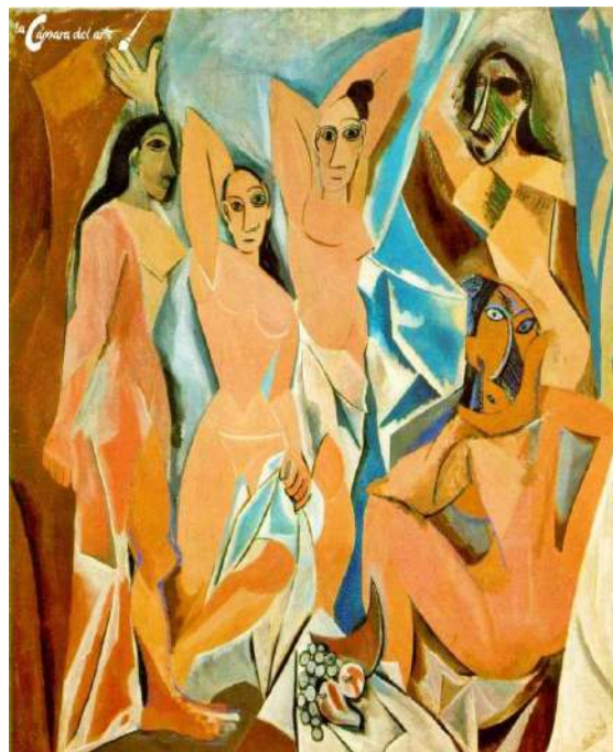
Las señoritas de Avignon. MoMA