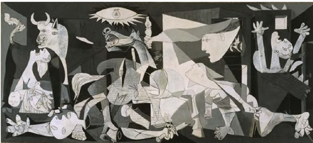
Imagen 1. Guernica. Museo Reina Sofía

112 Esta obra contiene un nivel de figuras un tanto abstractas, sin llegar a su totalidad, ya que no se puede inferir el entorno plasmado, la composición de las figuras y la continuidad de las mismas, pero se encuentra un grado de iconización visible, pues localizamos extremidades y rostros humanos con características específicas que nos permite descubrir emociones, apariencia e incluso el sexo de los objetos. Por otra parte, también se plasma la anatomía de animales muy emblemáticos en la cultura española como lo es el caballo y el toro estos animales son utilizados en la tauromaquia, uno de los mejores eventos tradicionalistas del país, “un espectáculo que nació en España en el siglo XII cuando la nobleza abandona el toreo a caballo y la plebe comienza a hacerlo a pie, demostrando su valor y destreza” (Von Dalguel, 2007).